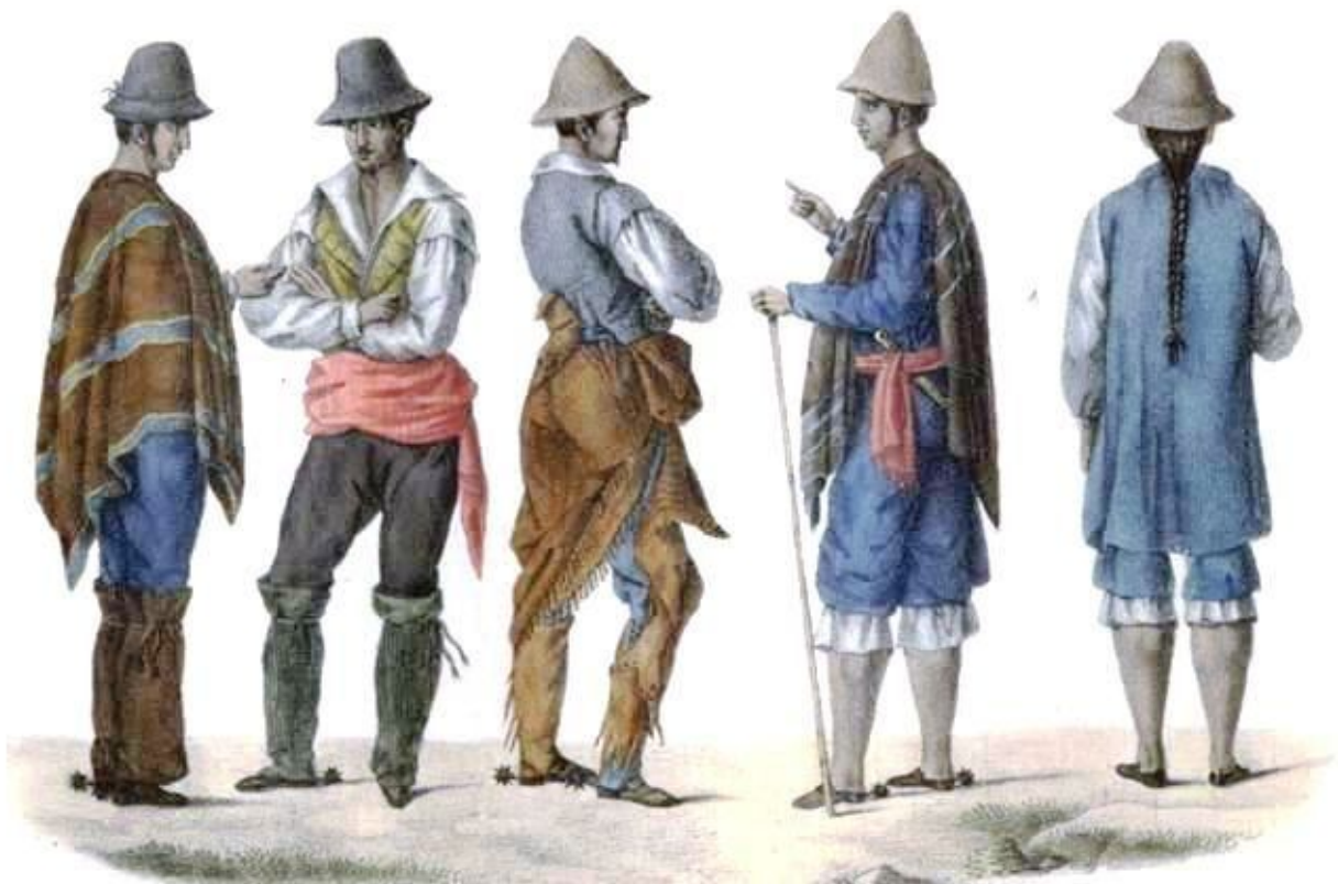
Trabajadores rurales (Alcide d' Orbigny, 1808)