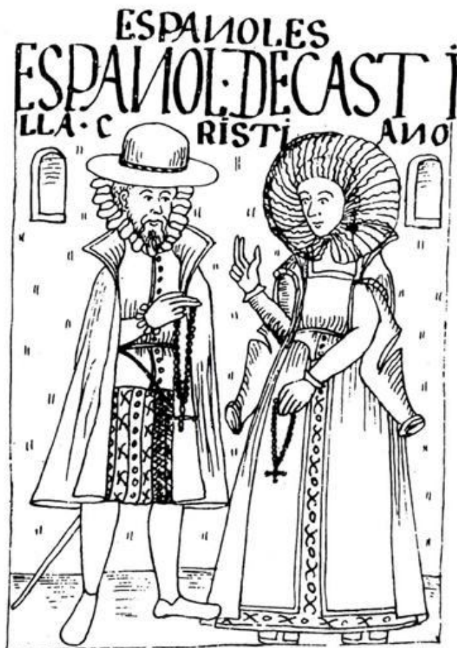
Fuente: Felipe Guaman Poma de Ayala, "Nueva Crónica y Buen Gobierno"